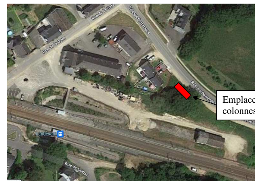
Emplacement de 4 colonnes enterrées.

Après en avoir discuté et délibéré, le Conseil Municipal, à l'unanimité des membres présents, valide les emplacements proposés ci-dessus.